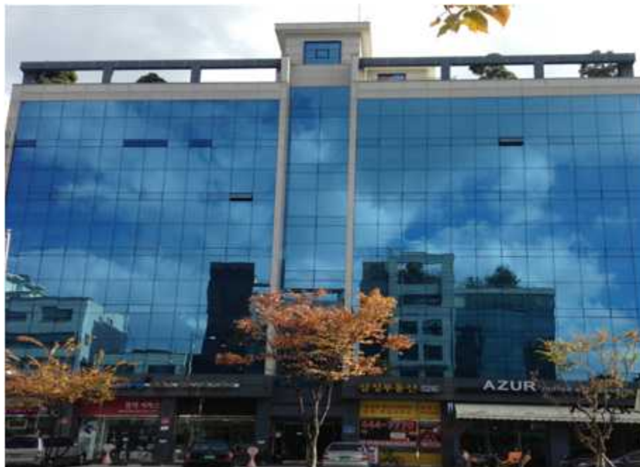
그림 42 능동 19-1 지점에서 본 북쪽 전경