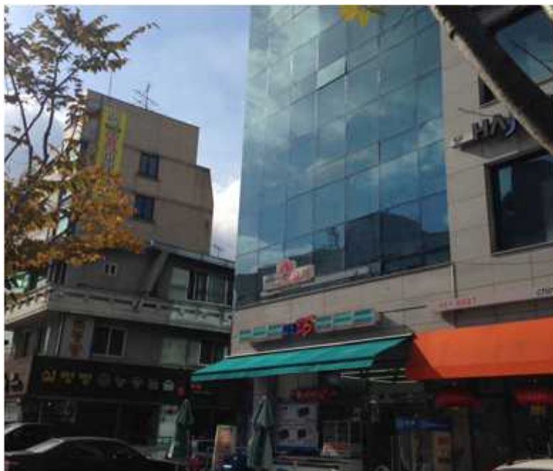
그림 44 능동 19-1 지점에서 본 서쪽 전경