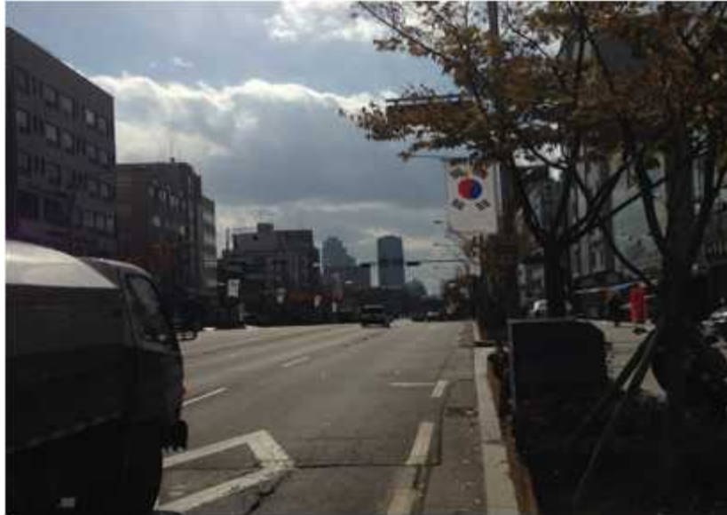
그림 43 능동 19-1 지점에서 본 남쪽 전경