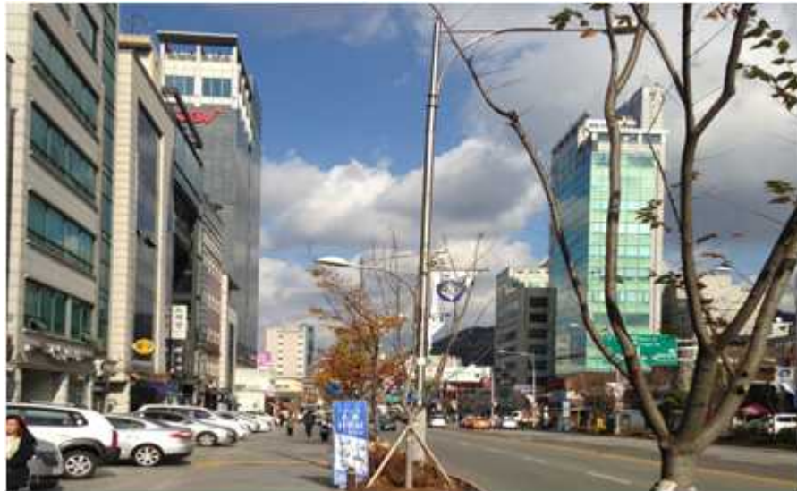
그림 41 능동 19-1 지점에서 본 북쪽 전경