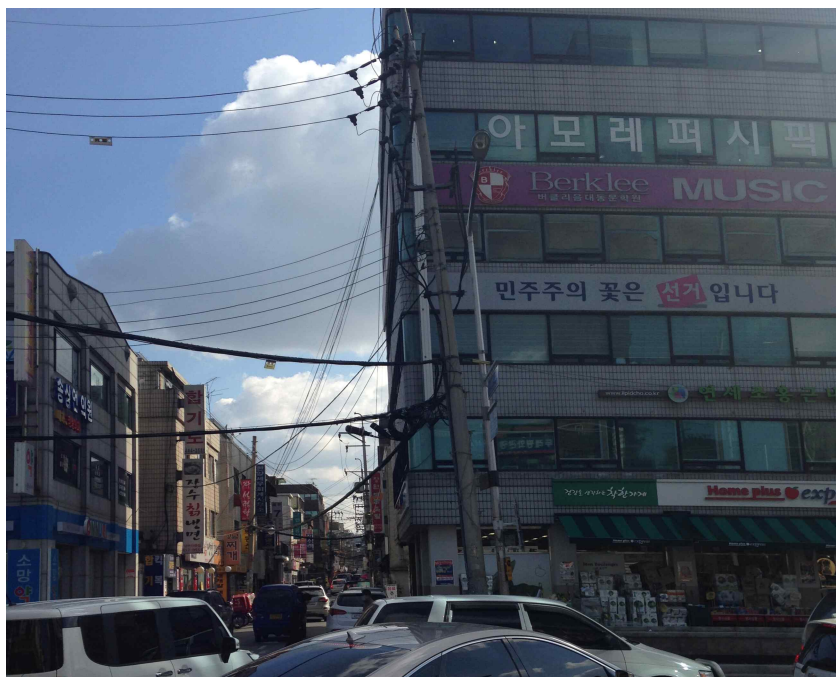
그림 118 능동 추4-1 지점에서 본 동쪽 전경