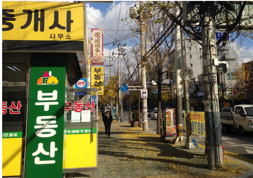
그림 117 능동 추4-1 지점에서 본 북쪽 전경