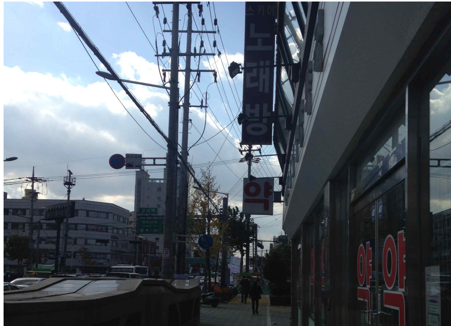
그림 119 능동 추4-1 지점에서 본 남쪽 전경