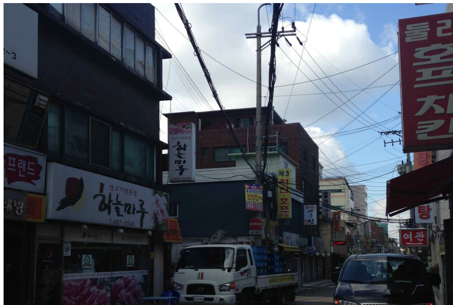
그림 120 능동 추4-1 지점에서 본 서쪽 전경