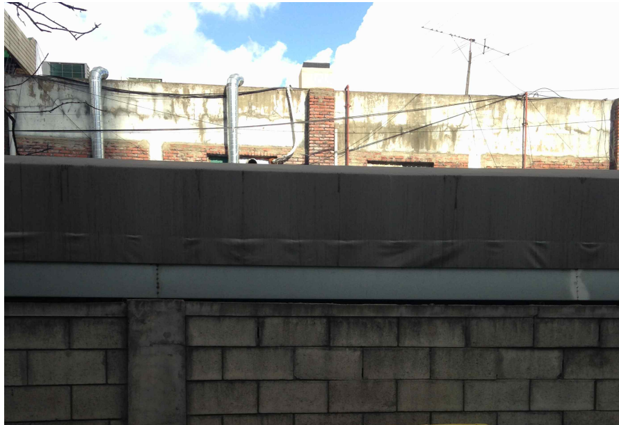
그림 155 능동 추5-2 지점에서 본 북쪽 전경