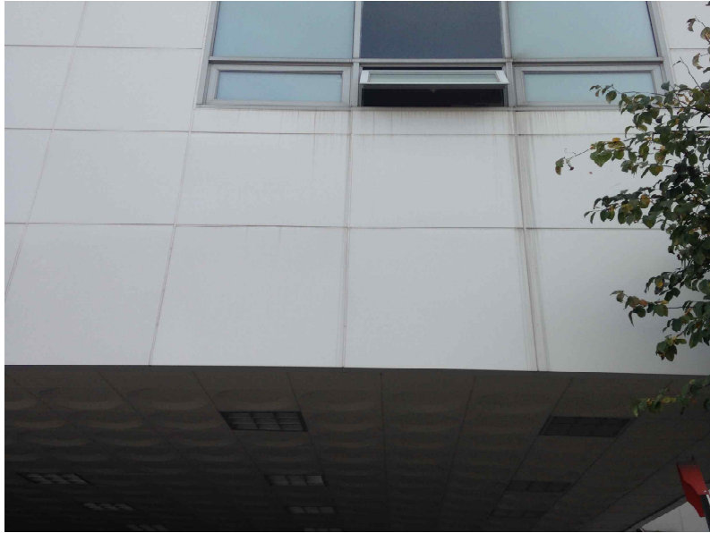
그림 157 능동 추5-2 지점에서 본 남쪽 전경