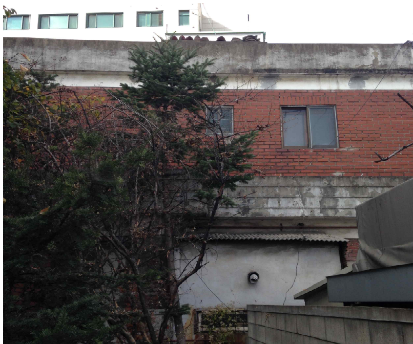
그림 158 능동 추5-2 지점에서 본 서쪽 전경