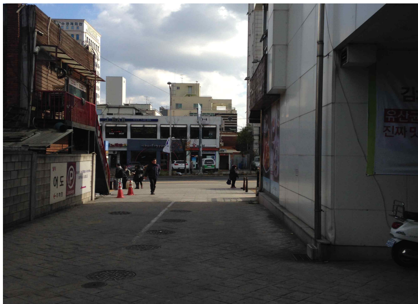
그림 156 능동 추5-2 지점에서 본 동쪽 전경