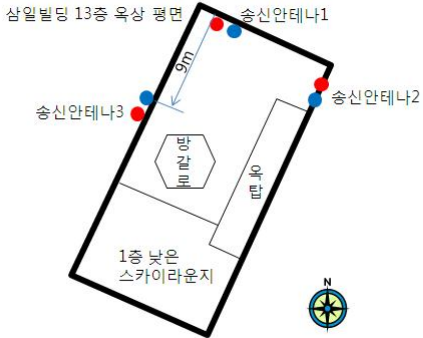
그림 419 능동지역 송신 안테나 상세위치도