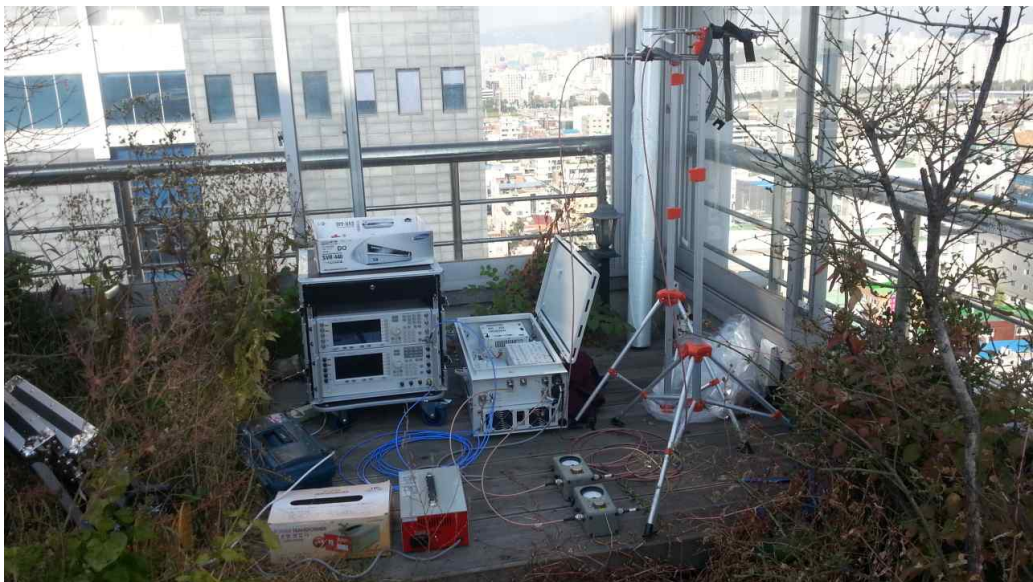
그림 420 능동 송신안테나 1