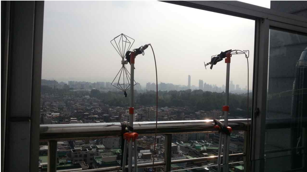
그림 421 능동 송신안테나 2