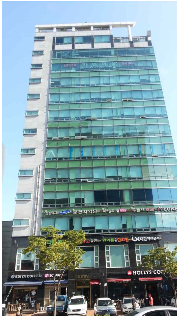
그림 418 능동 송신소 건물 전경