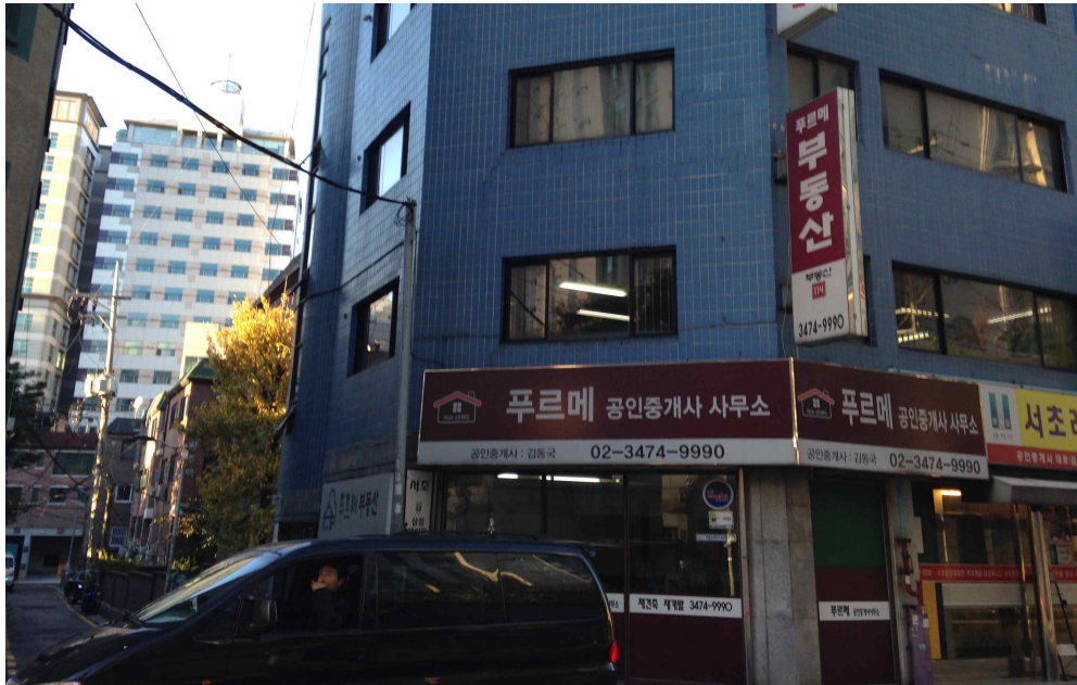
그림 367 강남 13-1 지점 북쪽 전경