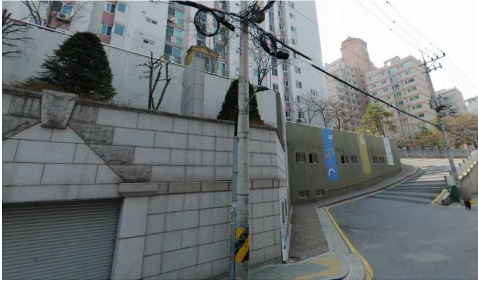
그림 369 강남 13-1 지점 남쪽 전경