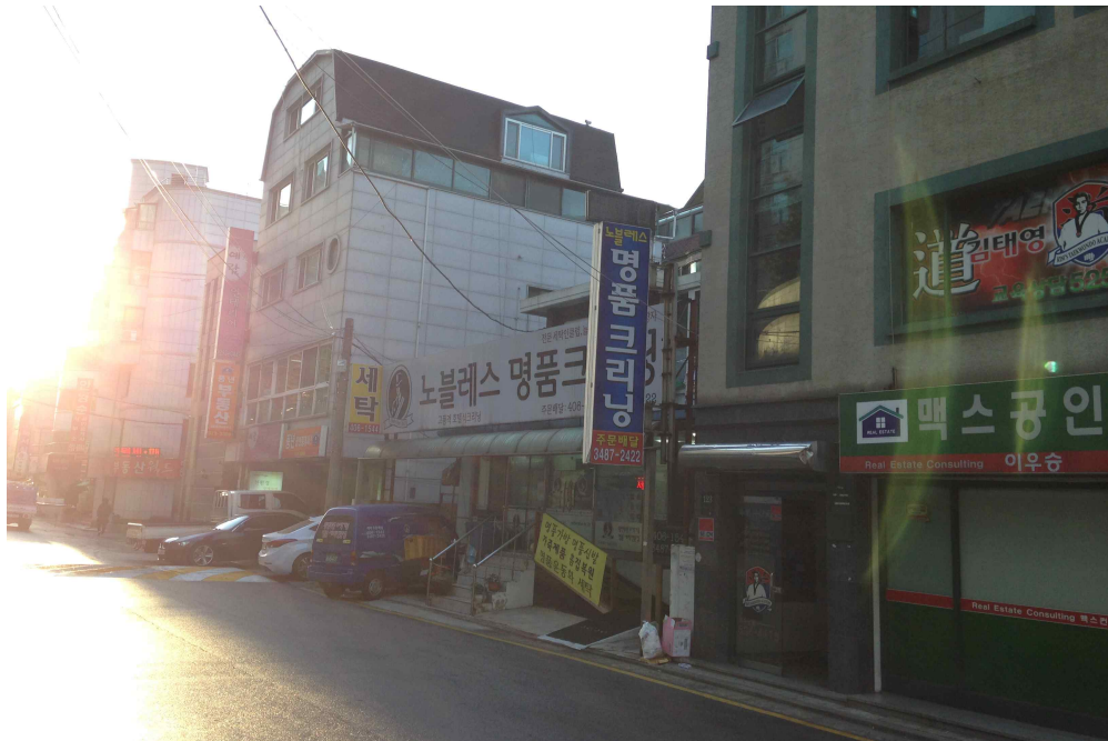
그림 370 강남 13-1 지점 서쪽 전경