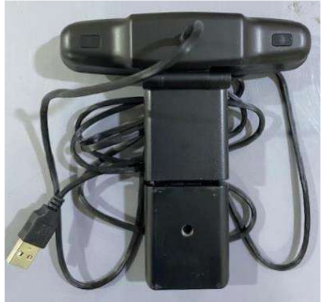
< 후 면 >