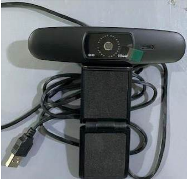
< 전 면 >