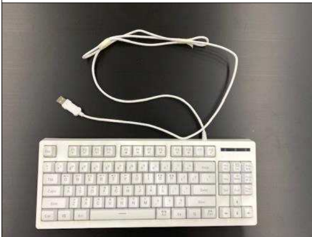
< 전 면 >